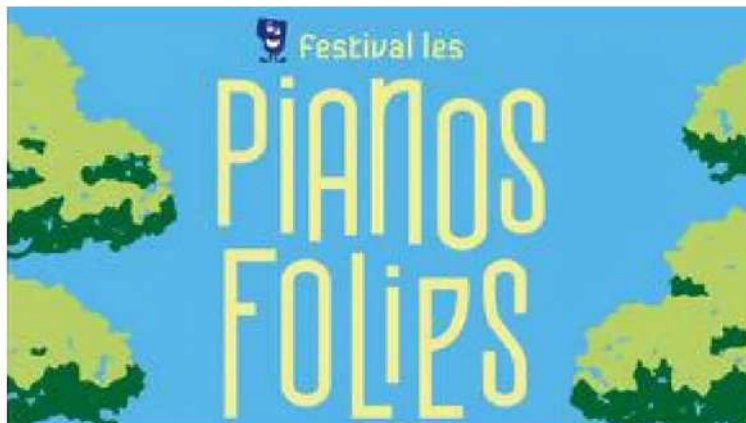
affiche festival Les pianos folies - Les pianos folies

Le festival Les pianos folies aura lieu pour sa 14 ème édition du 1er au 6 juin au Touquet mais aussi à Montreuil, Hesdin ou encore Rang du Fliers. Un festival qui permet à des jeunes talents des conservatoires de la région de rencontrer des grands noms internationaux de la musique classique rendue accessible à tous.