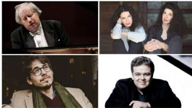
En haut à g. Grigory Sokolov & d. Les sœurs Labèque. En bas à g. Lucas Debarque et Arcadi Volodos.

Le festival des Pianos folies revient au Touquet dans sa nouvelle mouture. Plus tôt dans l'année, plus ouvert sur les écoles et conservatoires, il reste incontournable pour les mélomanes. On fait le point sur les nouveautés et les valeurs sûres.