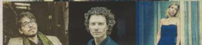
Musiciens, festival Off, concerts, auditions, le tout rythmé par de grands sons !