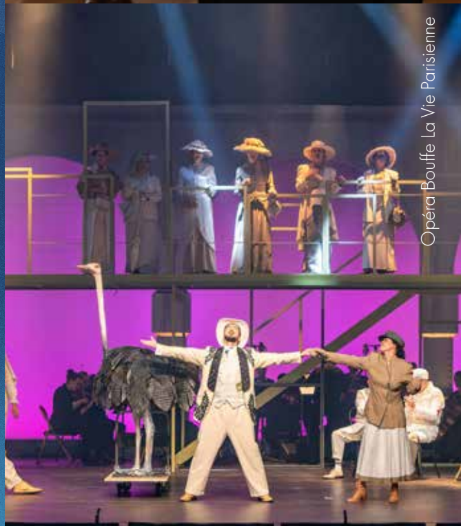
Opéra Bouffe La Vie Parisienne